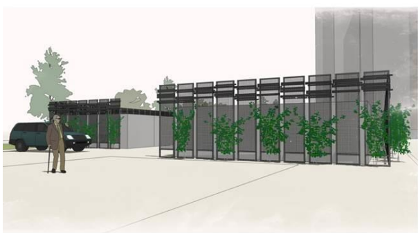
ФАСАДНО ОФОРМЛЕНИЕ С ДЕКОРАТИВНИ МЕТАЛНИ ПАНА И КАТЕРЛИВА РАСТИТЕЛНОСТ ВАРИАНТ 1

Територията на парк "Радост" е подходяща за развитието на различни по функция зони, свързани с отдиха на открито, игри, спорт, развлечения и социални контакти. Инвестиционният проект предвижда обособяване на: комбинирана детска площадка за възрастни групи от 0 - 3 г. и от 3 - 12 г. и полагане на еластична подова настилка; площадка за фитнес на открито; площадка за игра на тенис на маса с две маси; две зони за покрити беседки; монтиране на