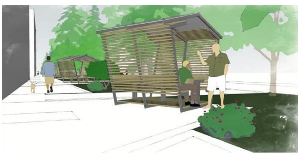
КЪТ ЗА ОТДИХ

Територията на парк "Радост" е подходяща за развитието на различни по функция зони, свързани с отдиха на открито, игри, спорт, развлечения и социални контакти. Инвестиционният проект предвижда обособяване на: комбинирана детска площадка за възрастни групи от 0 - 3 г. и от 3 - 12 г. и полагане на еластична подова настилка; площадка за фитнес на открито; площадка за игра на тенис на маса с две маси; две зони за покрити беседки; монтиране на